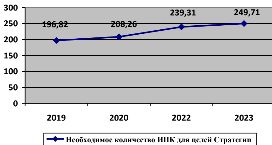
Рисунок 2- Необходимое количество ИПК для достижения уровня пенсионных выплат (2,5 ПМП)

На протяжении 2019-2023 гг. расчетный ИПК для достижения целей Стратегии постоянно возрастал (рис.2).