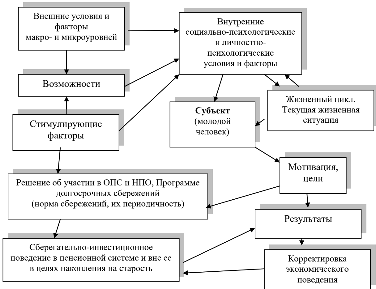
Рисунок 4 - Многофакторная модель экономического поведения молодежи в пенсионной системе

Многофакторная модель экономического поведения молодежи в пенсионной системе представлена на рис.4.